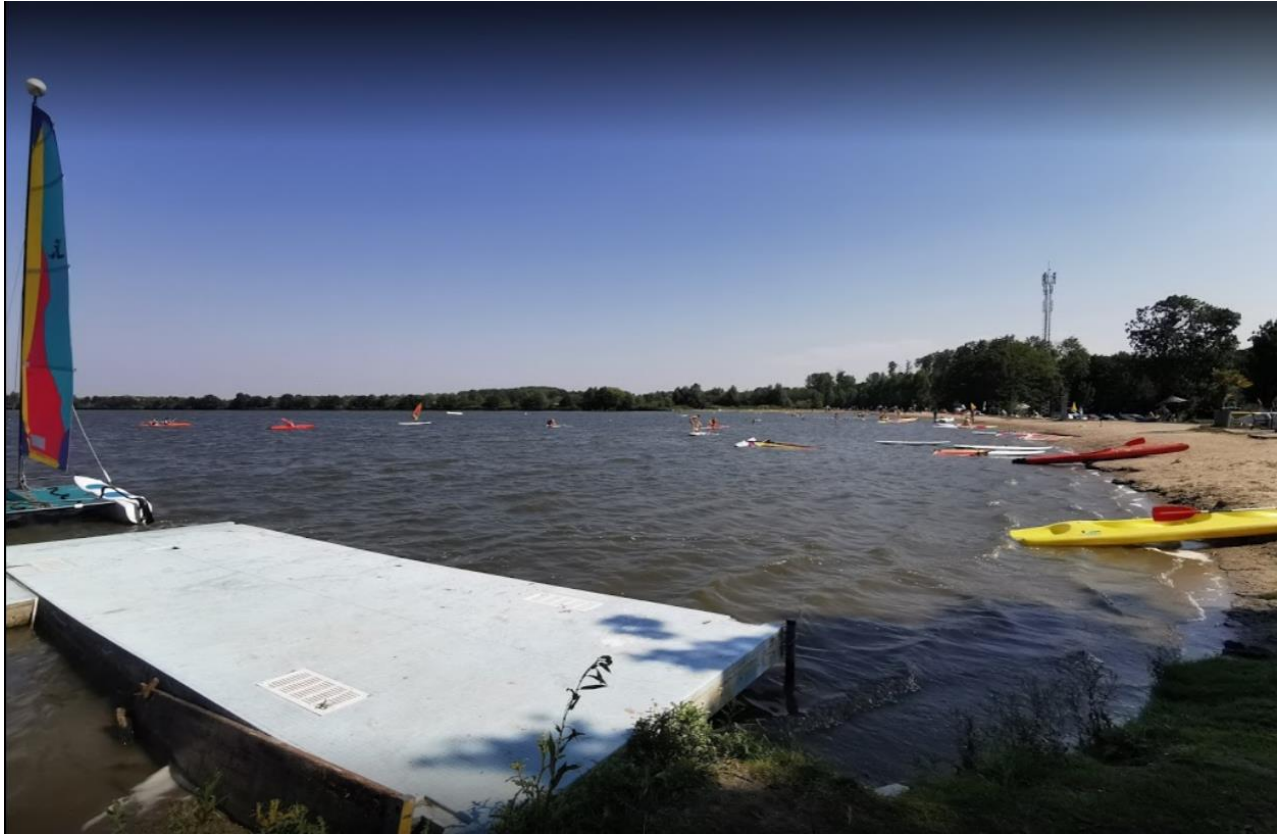
Het Bovenwater bij Lelystad